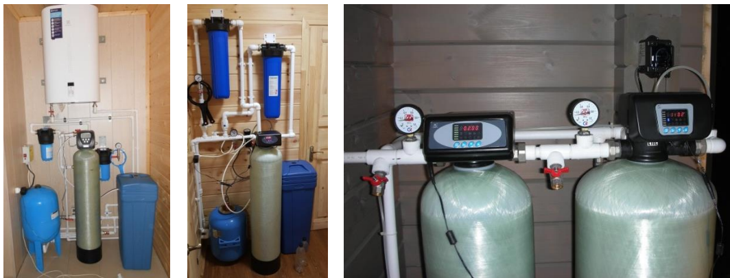
Рисунок 2 – Примеры водоочистных систем ЭКОВИТА на основе засыпных колонн